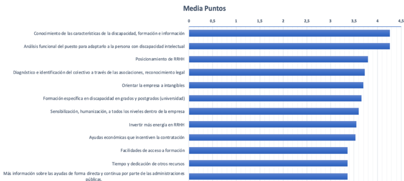
Gráfico 4. Principales necesidades relacionadas con la contratación de personas con discapacidad intelectual