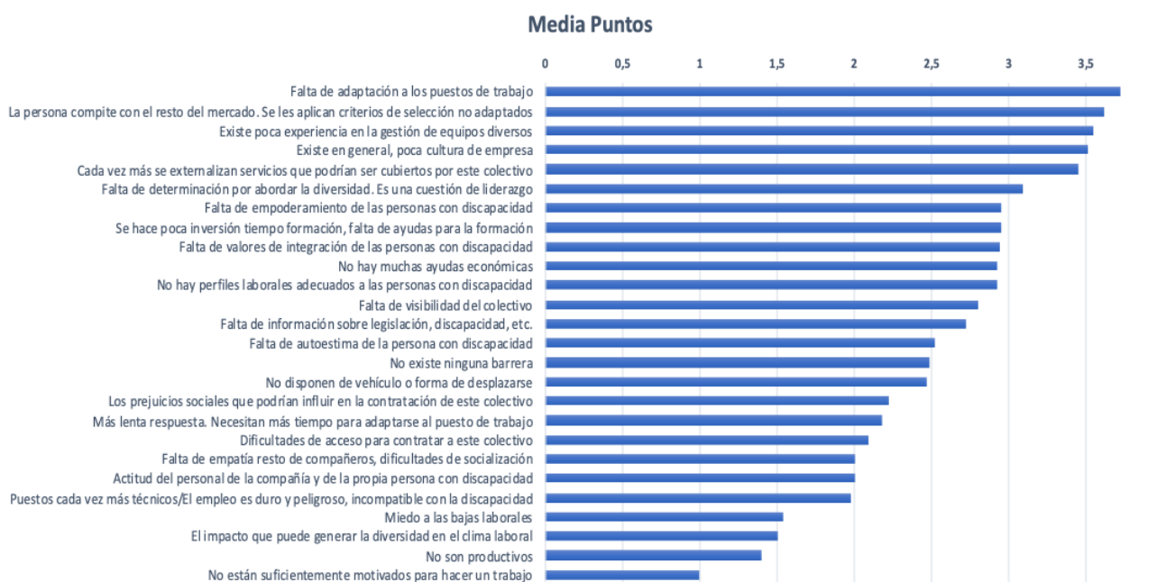
Gráfico 1: Principales barreras para la contratación de personas con discapacidad intelectual