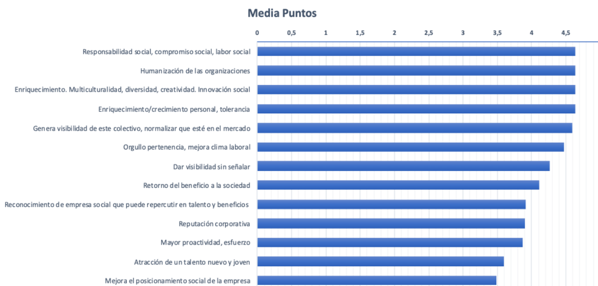
Gráfico 3. Principales ventajas derivadas de la contratación de personas con discapacidad intelectual